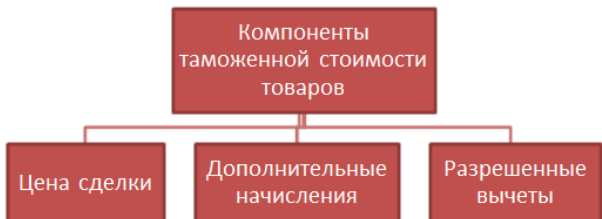
Рисунок 1 – Компоненты таможенной стоимости товаров

Рассмотрим показатели декларирования товаров в регионе деятельности Новороссийской таможни за 2013-2015 гг., представленные в таблицах 1-3.