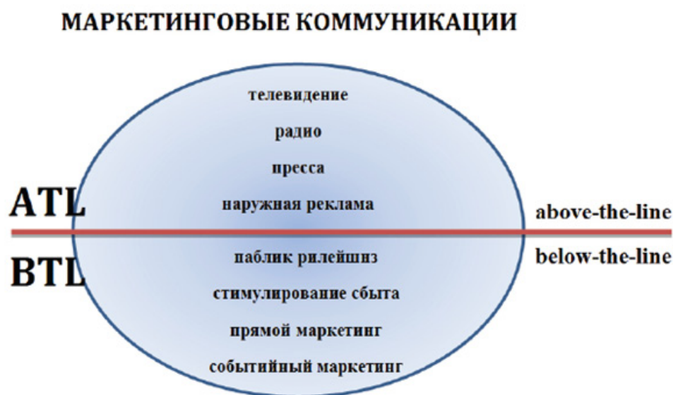
Рисунок 1 - ATL и BTL коммуникации в сфере ФКиС

В западном спортивном бизнесе все элементы маркетинговых коммуникаций можно разделить на 2 сектора – ATL и BTL коммуникации, которые формируют систему интегрированных маркетинговых коммуникаций (рис. 1) 2 .